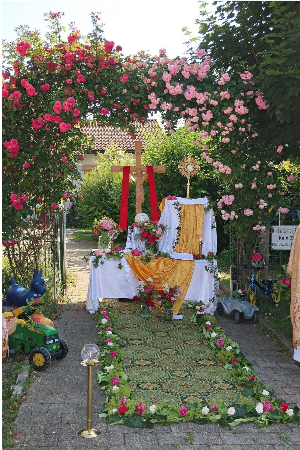
Fronleichnamssaltar beim Kindergarten Niederstaufer 2025

BÖ = St. Nikolaus Bösenreutin – HW = St. Ambrosius Hergensweiler – SI = St. Gallus Sigmarszell – NI = St. Peter und Paul Niederstaufer – WE = St. Markus Weißensberg