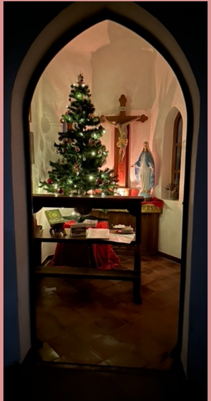
(Kapelle Weißensberger Halde Advent 2023)